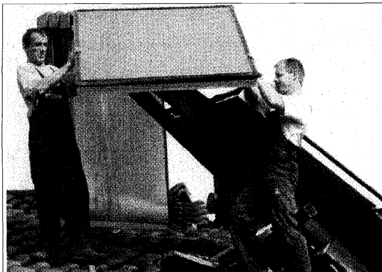
Überall in der Region können morgen Freitag, am «Tag der Sonne», Solaranlagen besichtigt werden.

Der nationale Aktionstag wird im Kanton Baselland unterstützt von der Elektra Birsack Münchenstein, von den IWB, der Elektra Baselland, der Wirtschaftskammer und dem Hauseigentümergebiet BL, der Schweizerischen Vereinigung für Sonnenenergie, dem Gebäudetechnikerverband suissetec und den Energiefachleuten beider Basel.